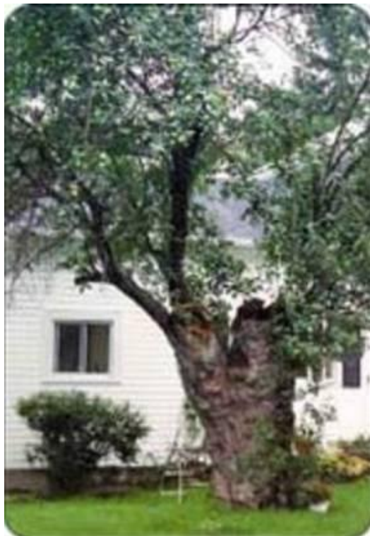
Ramboträd som anses vara planterat av John Chapman