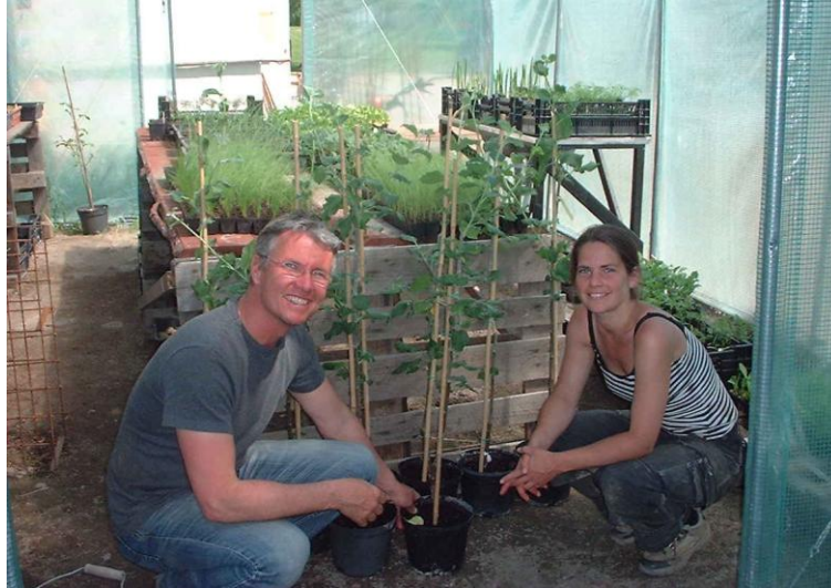
Plantorna levererades till Wij.