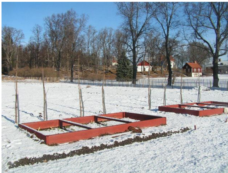
Plantorna på Wij i februari 2008.

Under vintern 2007-08 stod de återstående sex svenska plantorna vid Wij. Tyvärr upptäckte rådjuren att de var goda att äta, men lyckades inte förstöra dem.