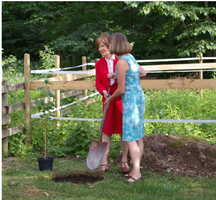
Planteringen vid Sävja.