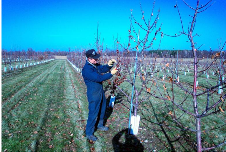
Ympriset tas vid Cornell vintern 2006

Den 29 november 2005 beviljade Jordbruksverket importtillstånd.