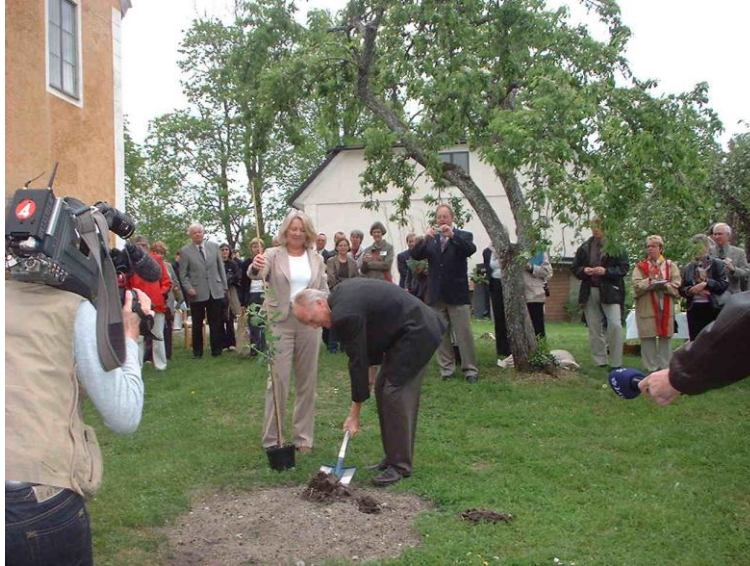
Planteringen på Lövsta